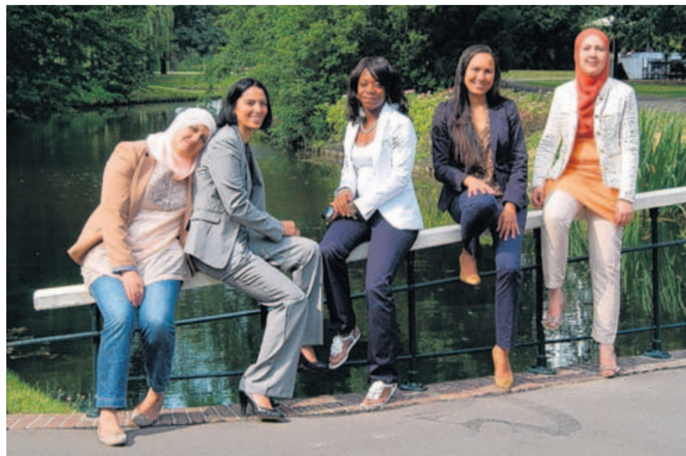
Stichting Voorlichters Gezondheid: “Wij staan voor kennisoverdracht”

Stichting Voorlichters Gezondheid bestaat uit een team van zeven enthousiaste meiden, opgeleid door Zorgcampus tot Voorlichter in de perinatale gezondheid. Met culturele achtergronden als Turks, Marokkaans, Surinaams, Portugees en Antilliaans, vormen zij een goede afspiegeling van de Rotterdamse samenleving. “Het